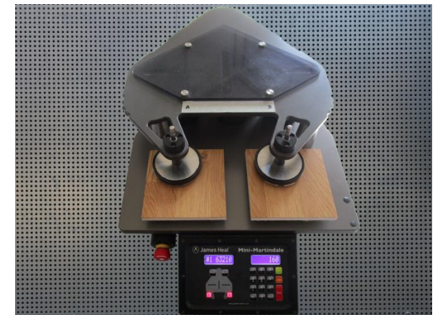
Martindale Scheuer- und Pillingtester

Interessiert? Hier klicken für weitere Infos