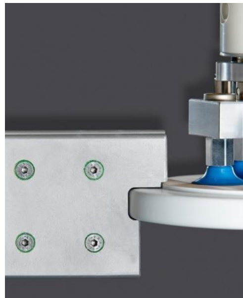
TRANSFERDISC by Schiele Maschinenbau GmbH