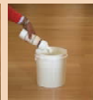
3. Pflege mit HYDRO CARE